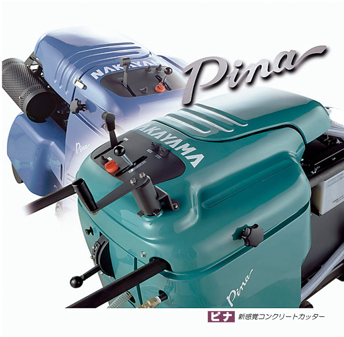
ピナ 新感覚コンクリートカッター