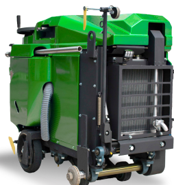
グリーンメタリック